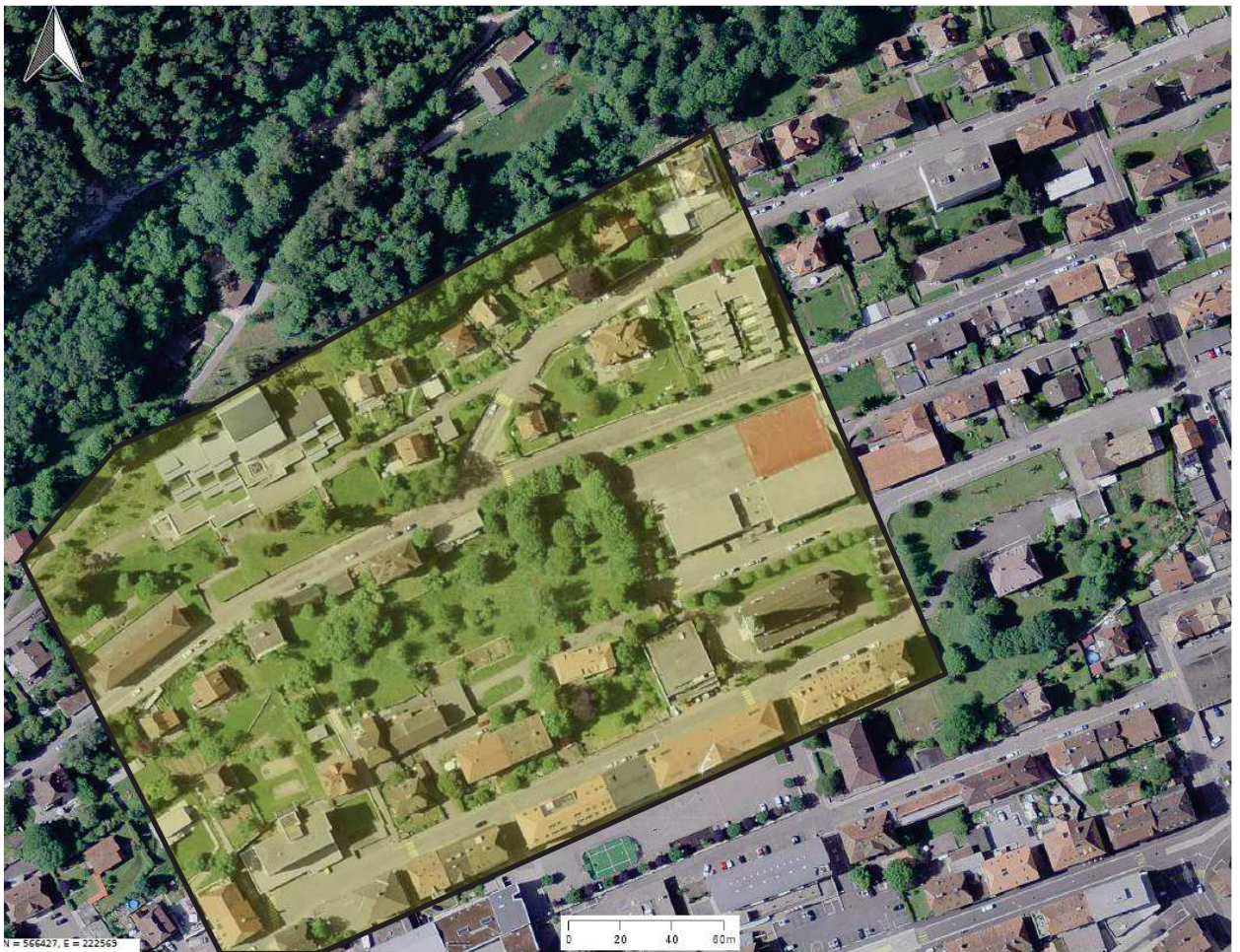
Esquisse du secteur prévu pour une future extension du CAD au centre de la localité.